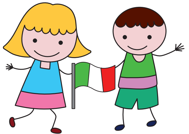
DIRITTO ALLA NAZIONALITÀ